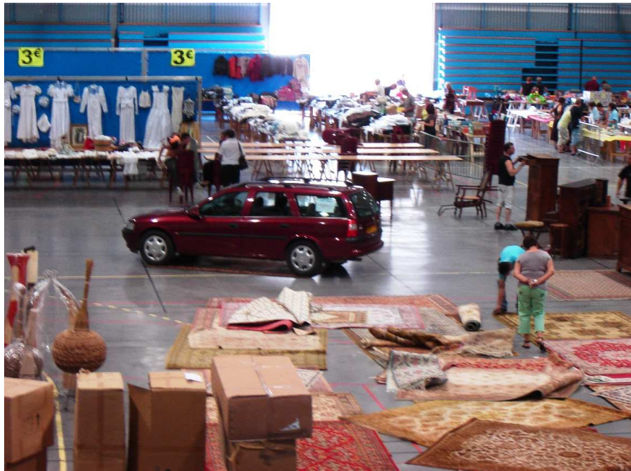
Photos archives de la grande vente du Mouzon de 2011