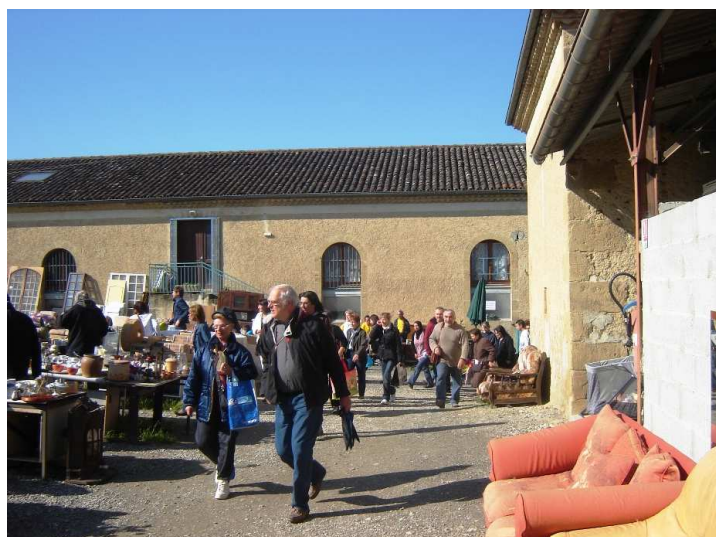
A l'ouverture, ruée sur les bonnes affaires.

Malgré le peu de publicité, le montant des ventes s'est également amélioré passant de 17000 € à plus de 20000 €. Le rayon électroménager a bénéficié de nombreux articles neufs dont une dizaine de Karchers. Les vêtements et le bazar ont également boosté les ventes, tout cela grâce à l'engagement des compagnes, compagnons, amis et responsables ravitaillés en vol par