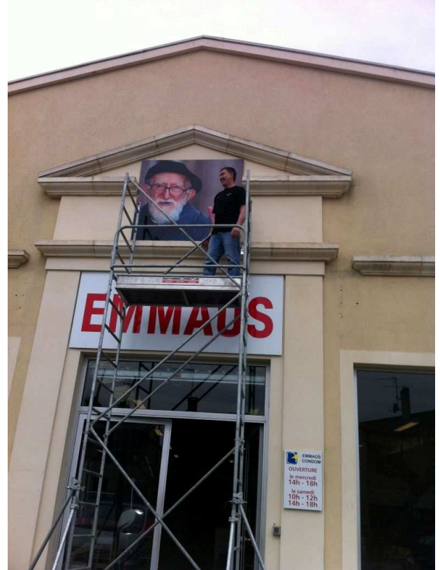
Installation du portrait de l'Abbé Pierre