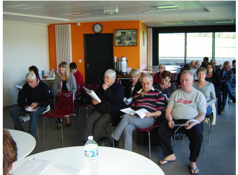
Une assemblée à l'écoute dans le réfectoire de la résidence sociale d'Auch.

Le 14 avril 2013, l'assemblée générale de l'association Emmaüs Gers-Gascogne a réuni 17 amis sur les 32 de l'association, le responsable et 4 compagnons. Sept amis absents avaient donné leur pouvoir aux présents.