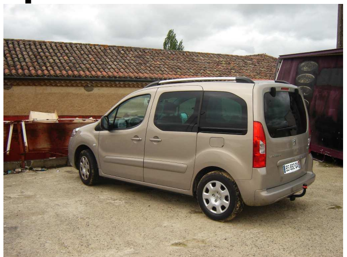
Une des deux nouvelles voitures de la communauté