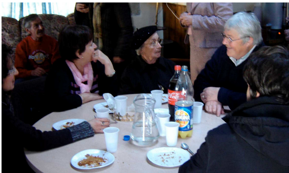
Partage convivial de la galette des rois

★ Le 15 janvier les amis et les compagnons se sont retrouvés dans une ambiance très chaleureuse pour partager la galette des rois