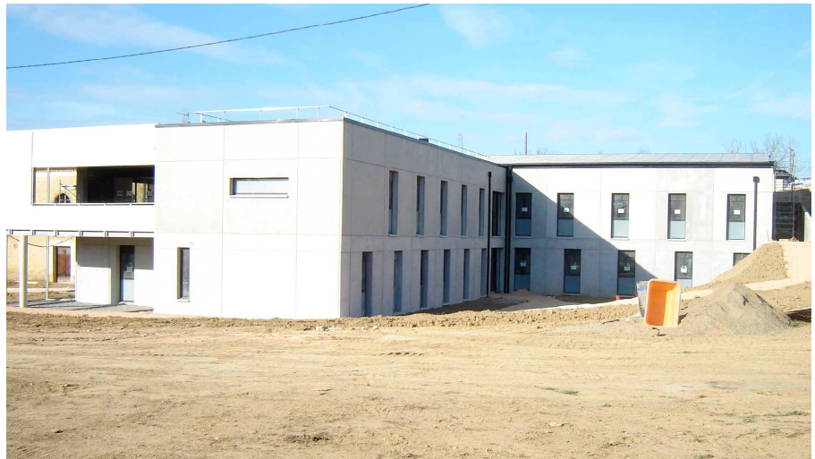
Résidence sociale pratiquement terminée

Initié en 2007 le projet de résidence sociale touche à sa fin avec l'inauguration prévue le 10 mai 2012. La première pierre a été posée en octobre 2010 sous la bénédiction des partenaires départementaux : préfecture, mairie d'Auch, Conseil Général et OPHLM. Pour l'inauguration tous sont attendus accompagnés par le président d'Emmaüs France Christophe Deltombe. Dans l'après-midi, celui-ci co-animera avec la Fondation Abbé-Pierre un forum sur le « Mal logement ». D'ores et déjà, 22 personnes représentant des entreprises et 43 bénévoles ont répondu favorablement à l'invitation.