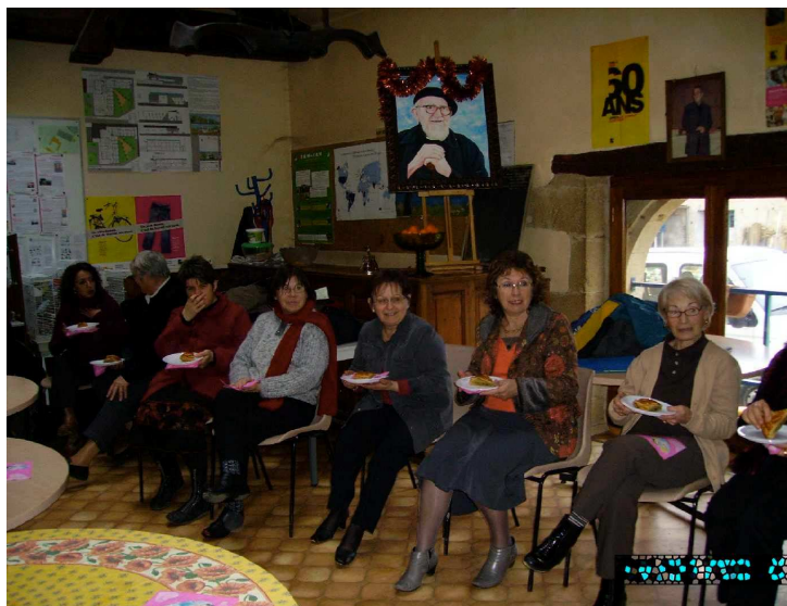
Une galette et une convivialité fort appréciées

★ 17 élèves du lycée du Garros ont visité la communauté le 20 janvier 2011. Très peu connaissaient son existence. Même si dans l'ensemble ils ne semblaient pas bien curieux, les questions ont fusé en abordant le recyclage des D3E (déchet d'équipement électrique ou électronique) faisant partie de leur cursus.