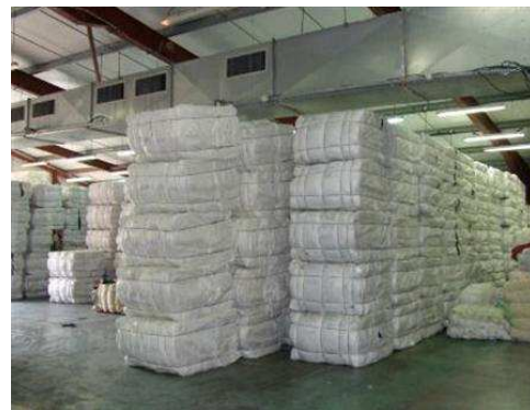
Exemple de plate-forme en Rhône-Alpes à Saint André le gaz : retraitement et logistique pour les communautés de la région sur 15 000 m 2

Parmi les 17 communautés nous retrouvons Bayonne, Pau, St Gaudens, Pamiers, Rodez, Albi, Périgueux, Castelsarrasin, Montauban, Grisolles, Auch, Agen, Bordeaux, Toulouse et Toulouse-Give.