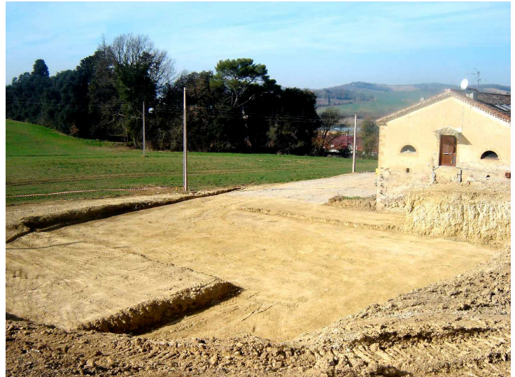
Fin du terrassement de la résidence sociale