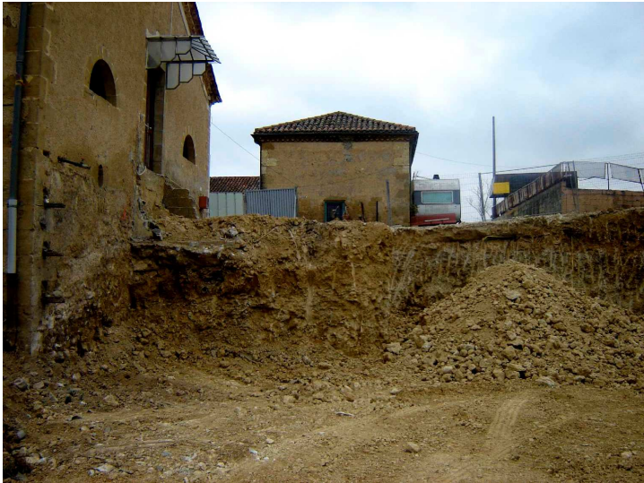
Travaux du côté de l'ancienne entrée du réfectoire

La résidence constitue une amélioration importante dans les conditions de vie des compagnons mais en tant que changement important des habitudes suscite également quelques inquiétudes chez certains. Ce point ne sera pas négligé en faisant participer au maximum les futurs locataires à la conception des finitions et des aménagements afin qu'ils s'approprient pleinement leur nouveau lieu de vie.