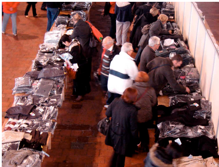
Vente de vêtements à la maison de Gascogne

Les stocks ont diminué, mais surtout le trépied a fait preuve de solidarité et entente, ce qui est somme toute la finalité de la démarche.