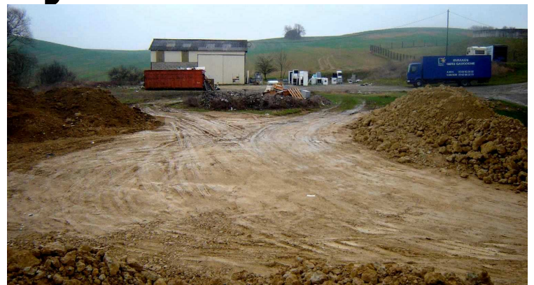
Préparation de l'emplacement du futur hangar