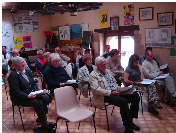
Amis et compagnons en AG