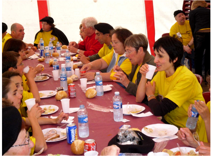
Une pause à midi, et ça repart.