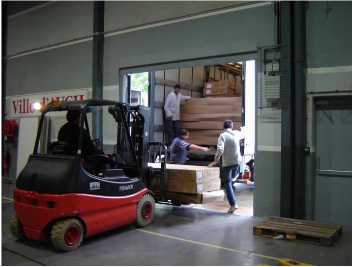
Déchargement d'armoires sous emballages