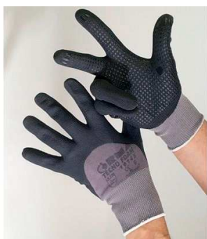
Exemple de gants professionnels

★ Des compagnons proposent la mise à disposition de gants pour le tri, l'aménagement d'un emplacement pour charger plus facilement la benne à ferraille et l'installation d'une benne pour les déchets.