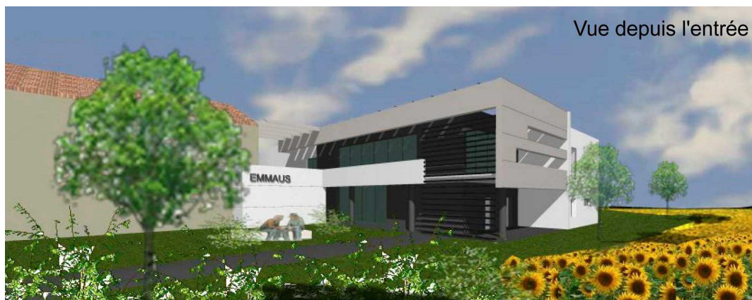
Vue depuis l'entrée