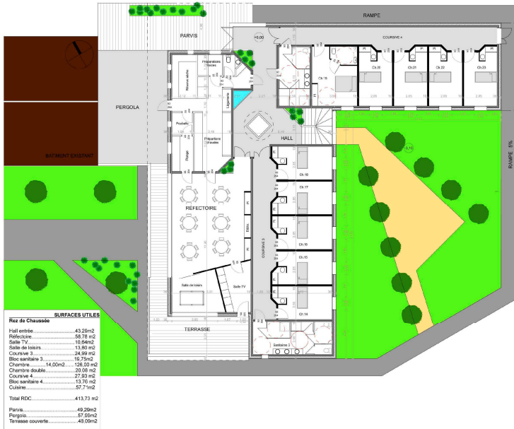
Rez-de-chaussée de la résidence sociale