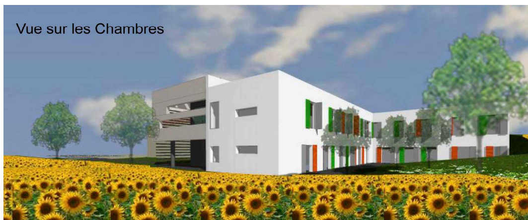
Vue sur les Chambres

En plus des plans de la résidence sociale, le cabinet d'architecture A3+ va fournir des propositions d'amélioration pour les bâtiments actuels. Rendez-vous pour la pose de la première pierre au cours du premier trimestre 2010.