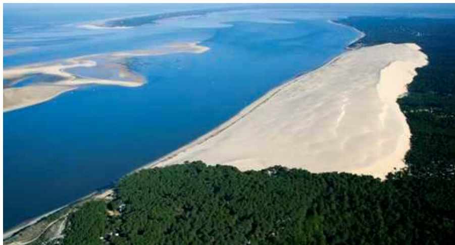
La dune du Pilat