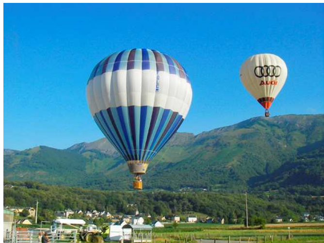
Après Auch, envol de la communauté d'Agen

Malgré la bonne volonté de tous, quelques grincements se sont produits qui heureusement se sont terminés dans la sérénité. Les éléments comptables arrêtés au 30 juin 2009 par M.BARANES ont été soumis au Conseil d'Administration qui les a approuvés. L'émotion réciproque de tous les membres du CA était palpable.