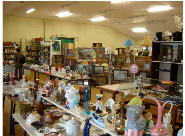
Rayons bibelots et meubles à Condom

de les épauler un maximum par une équipe de bénévoles locaux à même de les aider dans la mise en place, la vente et la tenue de la caisse. C'est la prochaine étape à réussir, sans oublier toutefois la communauté d'Auch qui commence à s'essouffler.