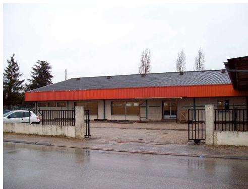
Parking et bâtiment de Condom

Détail des 5 départs : 3 en juin, 1 en juillet et 1 en août.