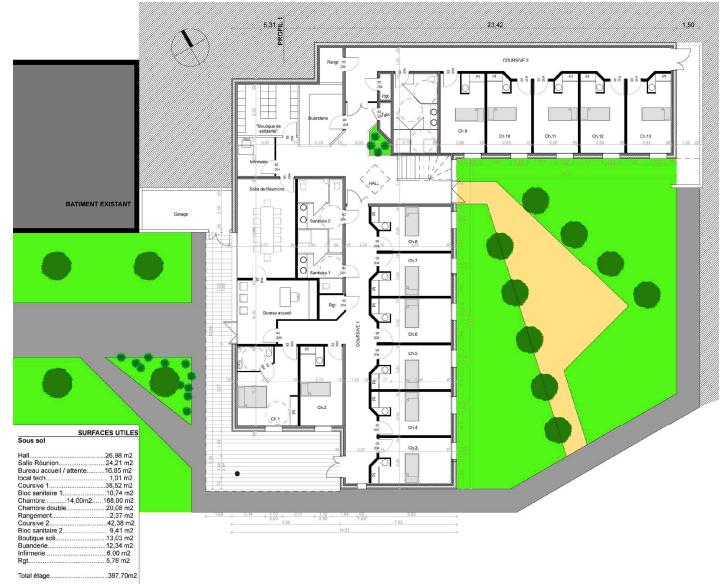
Sous-sol de la résidence sociale