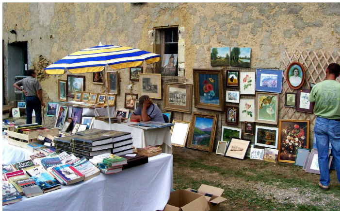
Vente exceptionnelle du 31 août. Le rayon tableaux