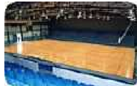
Salle du Mouzon à Auch