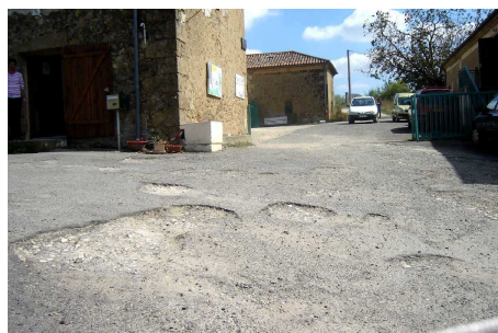
En projet : la réfection des voies d'entrée sur le site d'Auch.

★ L'association tiendra un stand au Forum des Associations au Parc des Expositions d'Agen le 29 septembre 2007.