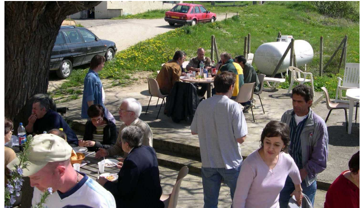
Il faisait beau à l'issue de la réunion, les participants ont mangé dehors

A Agen le ramassage en quantité et en qualité permet une activité quotidienne plus dynamique. Ouverture d'une friperie solidaire à Aiguillon dès le 1er juillet. Les moyens dégagés, devront permettre entre autre d'envisager un accueil hivernal spécifique.