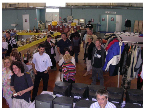
-<-> Parc des expositions d'Agen -<->